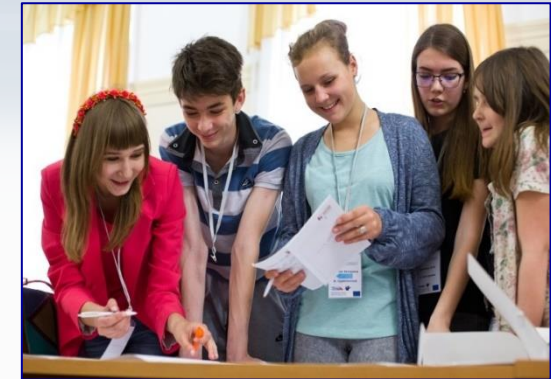
Робота над новим випуском газети «Шкільний Харків»