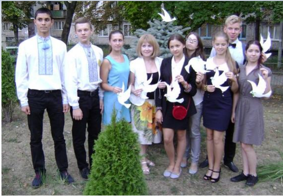
Велика рада старшокласників