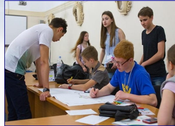
Інтеграція через спільну діяльність